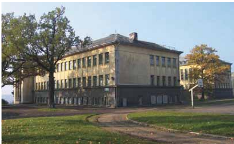
3 pav. Kiek toliau nuo įprastinių turizmo maršrutų senamiestyje ir naujamiestyje esantys tarpukario architektūros pavyzdžiai taip pat galėtų tapti paveldo bendruomenių dėmesio objektu 34

Ne vieną ideologinių galių persmelktą etapą perėjusi Kauno tarpukario architektūra ir šiuose pastatuose užkoduota patirtis turi milžinišką ir spalvingą naratyvų kūrimo potencialą. Tarpukario laikotarpio architektūrinis palikimas – ištisa to meto stilistinių architektūros krypčių paletė, jo fizinis karkasas mieste – akivaizdžiai gali būti siejamas su sodriu informacijos apie tarpukarių laukų ir reprezentuoti tuometinį Kauną kaip modernią Vakarų Europos sostinę plačiąja prasme. Taip būtų sutelktos vientisos medžiaginio ir nemedžiaginio paveldo struktūros, todėl įvairialypė, dispersiškai po miestą išsidėsčiusi ir šandienos paveldosaugos procesų nuošalyje paliekama tarpukario architektūros terpė sukibtų į vientisą prasmį ir reikšmių darinį bei taptų vertinga ir įprasminta miesto dalimi (3 pav.).