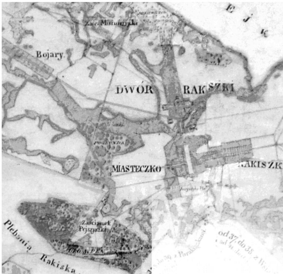
2 pav. Rokiškio grafystės žemėlapio dalis (M 1: 27 000 sumažintas 10 kartų) ir žemėlapio centro fragmentas Fig 2. Part of the map of Rokiškis county, scale 1:27,000 (decreased by 10 times) and a fragment of the map of the centre of Rokiškis

2. Litviniškių ir Skrebiškių žemėlapių sudarytojas juose savo pavardės neįrašė. Kadangi šie žemėlapiai sudaryti tais pačiais metais, ir jų atlikimo stilius analogiškas puošyba, žemėlapio sudedamųjų dalių išdėstymu ir net iš esmės tapačiais titulais, galima teigti ir apie tą patį autorių. Rokiškio grafystės žemėlapio sudarytojas savo vardą ir pavardę įsirašė žemėlapio titule kaip ir Pakruojo bei Šeduvos dvarų žemių planų sudarytojas.