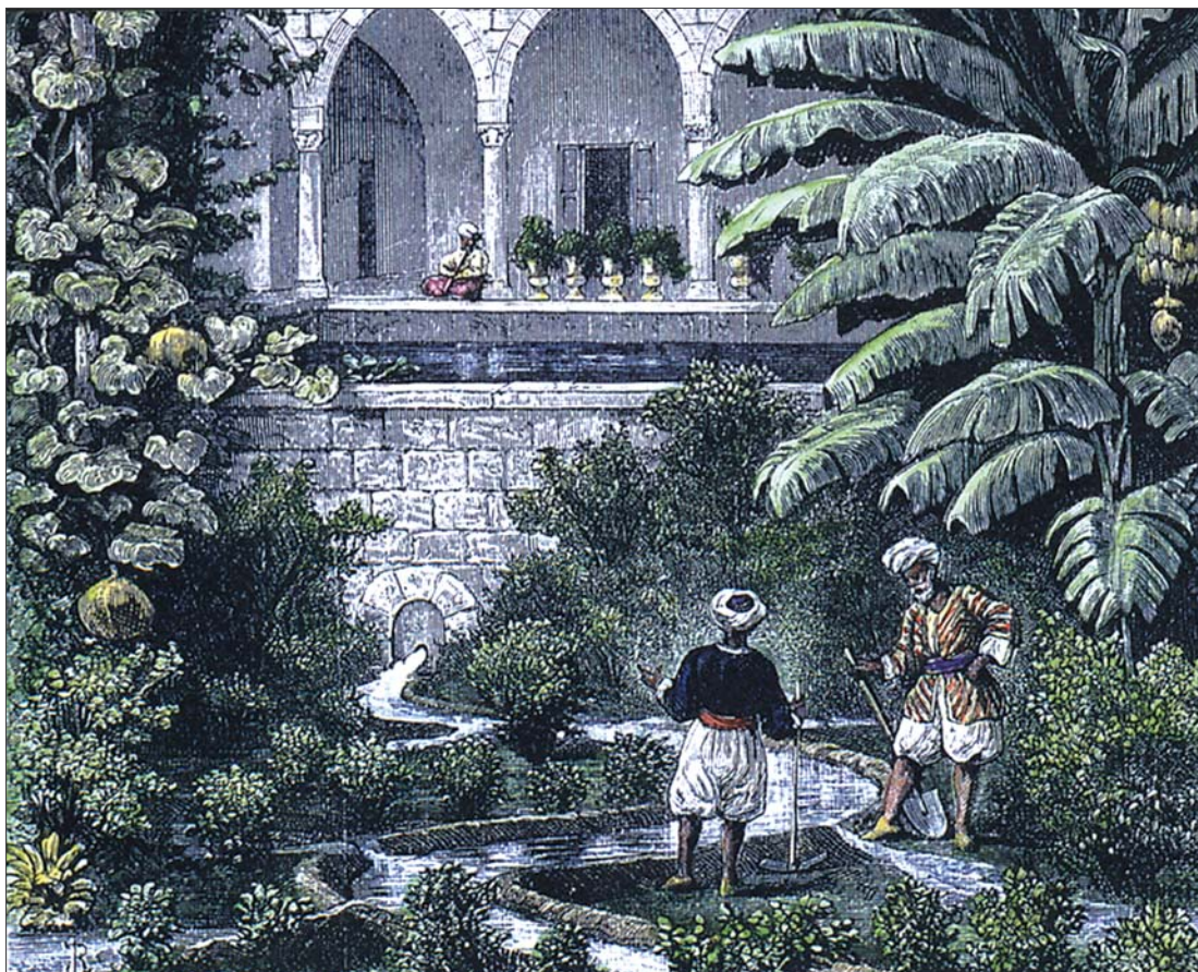
2 pav. Rojaus sodai, įveisti islamo užkariautojų Persijoje apie 637 m. po Kr., buvo dvasinės ramybės oazės, sukurtos laikantis Korano žodžių: „Šiame pasaulyje neturi būti sodų ir upių, jeigu jie nėra tokie, kokie buvo rojaus sodai ir upės“ Fig 2. The Paradise gardens, created by Islamic conquerors in Persia in 637 A.D., were the oasis for soul, created according to the words of Koran: „There would be no gardens in this world or rivers if it were not for the Gardens and Rivers of Paradise“.