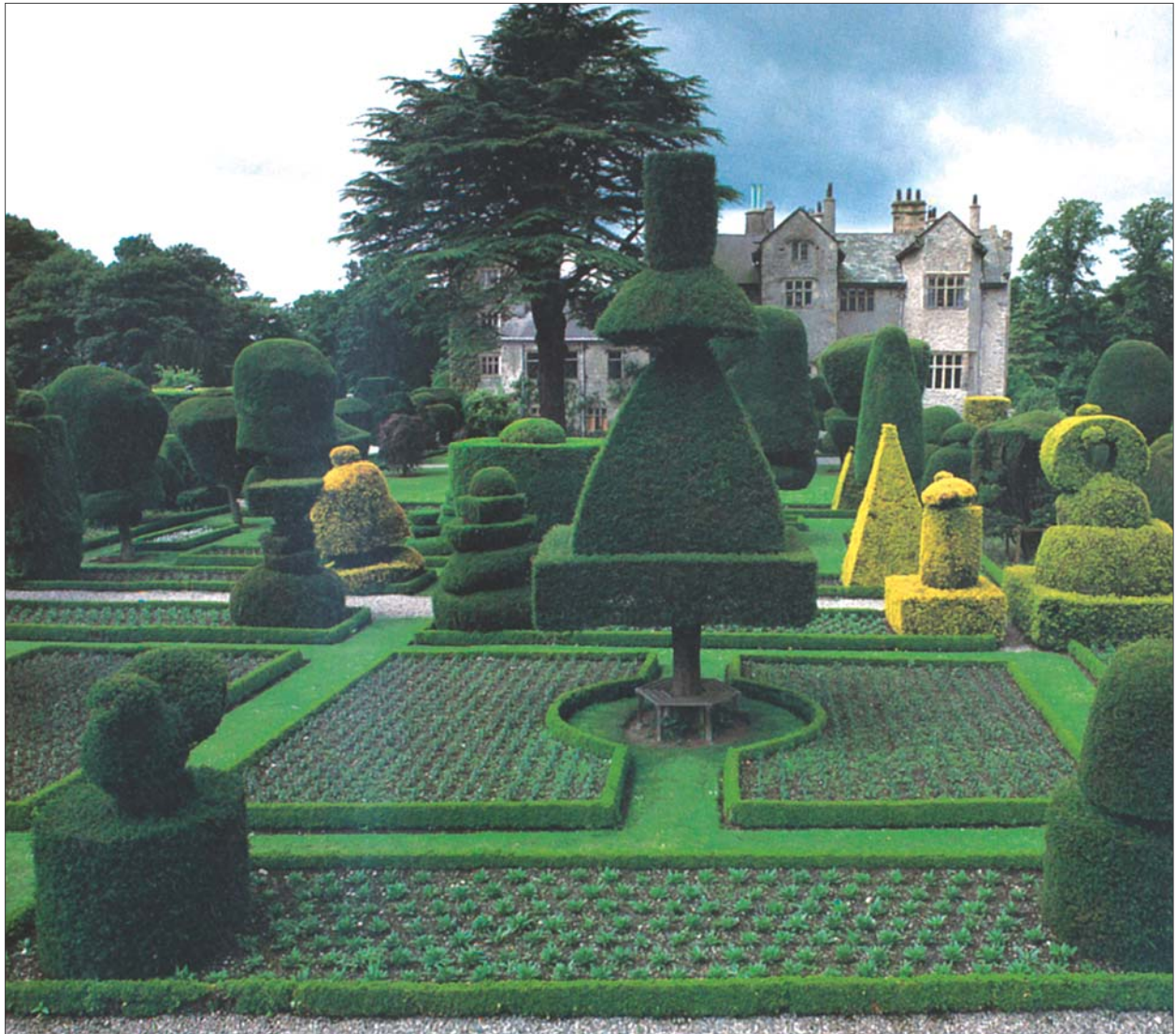
6 pav. Levens Hall parkas-sodas yra tikras figūrinio medžių karpymo meno laimėjimas Anglijoje XVII–XVIII a. Fig 6. Levens Hall orchard-park demonstrates achievements of the topiary art in England of the 17th–18th centuries