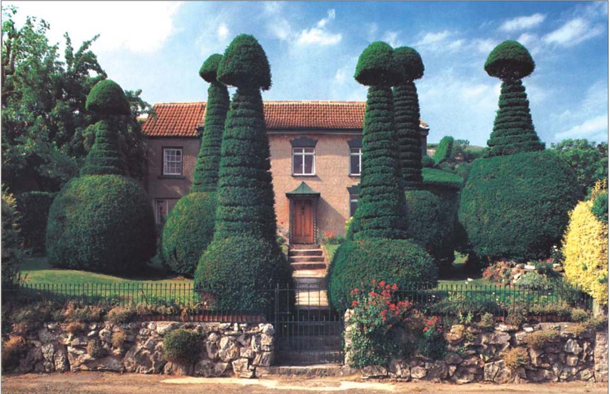
7 pav. Privataus kotedžo teritorijoje išlikęs figūrinio medžių karpymo pavyzdys Anglijoje netoli Bristolio. 1842 m. sodinti ir nuolat karpymu formuojami medžiai siekia iki 5 m aukščio ir savo unikalumu bei egzotika vilioja turistus

Fig 7. Example of pruned plants in the land plot of private cottage in England, near Bristol. Planted in 1842 and constantly formed by clipping, the trees are 5 m tall unique and exotic plants attracting a lot of tourists