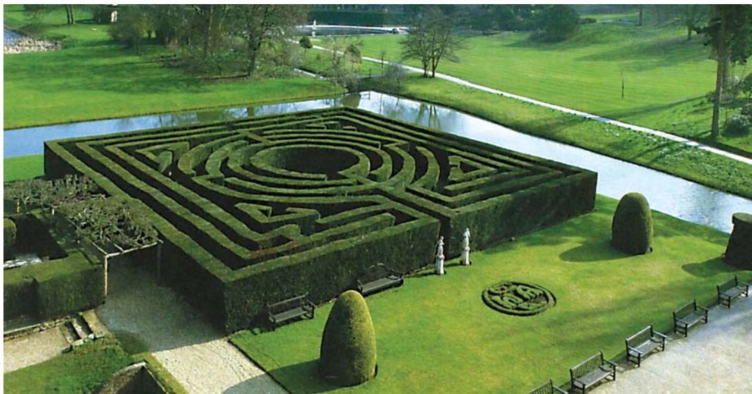
9 pav. Karpyto kukmedžio gyvatvorės labirintai – pagoniškių tradicijų atspindys XX a. pradžios Anglijos sodininkystėje – iliustruoja plačias figūrinio medžių karpymo meno galimybes

Fig 9. Mazes of topiary yew-tree hedges is a recurrence of the pagan ritual of the English horticulture at the beginning of the 20th century. It is an illustrative example of wide usage possibilities of topiary art