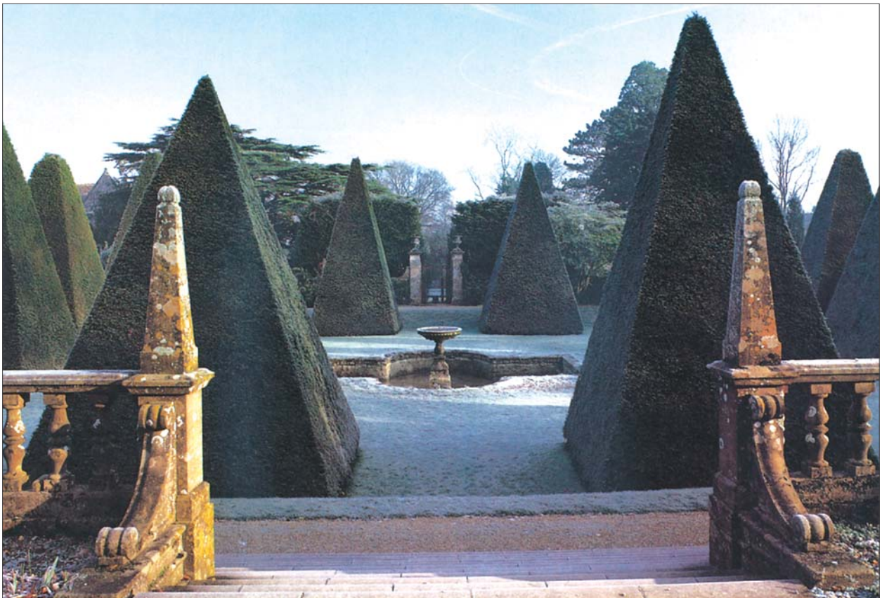
8 pav. Figūrinis medžių karpymas suteikiant jiems piramidės geometrinę formą ypač išpopuliarėjo Anglijoje XIX a. pabaigoje

Fig 7. Example of pruned plants in the land plot of private cottage in England, near Bristol. Planted in 1842 and constantly formed by clipping, the trees are 5 m tall unique and exotic plants attracting a lot of tourists