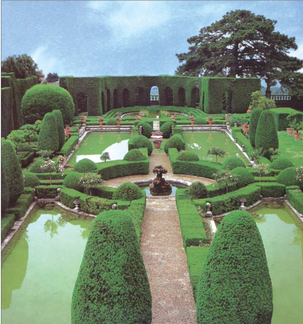
5 pav. Vila Gamberaja, esanti Florencijos priemiestyje, yra viena iš žaviausių vietų pasaulyje, sukurtų XV a. Ją supantis Princų parkas laikui bėgant tapo unikaliu pagal žmogaus užgaidas perkurtos gamtos pavyzdžiu

Fig 5. Villa Gamberaia, situated in the outskirts of Florence, is one of the most enchanting places in the world, created in the 15th century. The Park of Princes around the villa is extorting the nature according to the caprices of the man