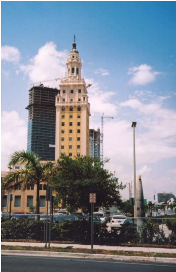
2 pav. Floridos „Laisvės rūmo“ respektavimas. Ekspozicinio (respektavimo) fono kūrimas, didinant tamsaus foninio statinio aukštį

Fig 2. Respect of Freedom Palace in Florida. Formation of exhibitional (respect) background by increasing the height of obscure building in the background