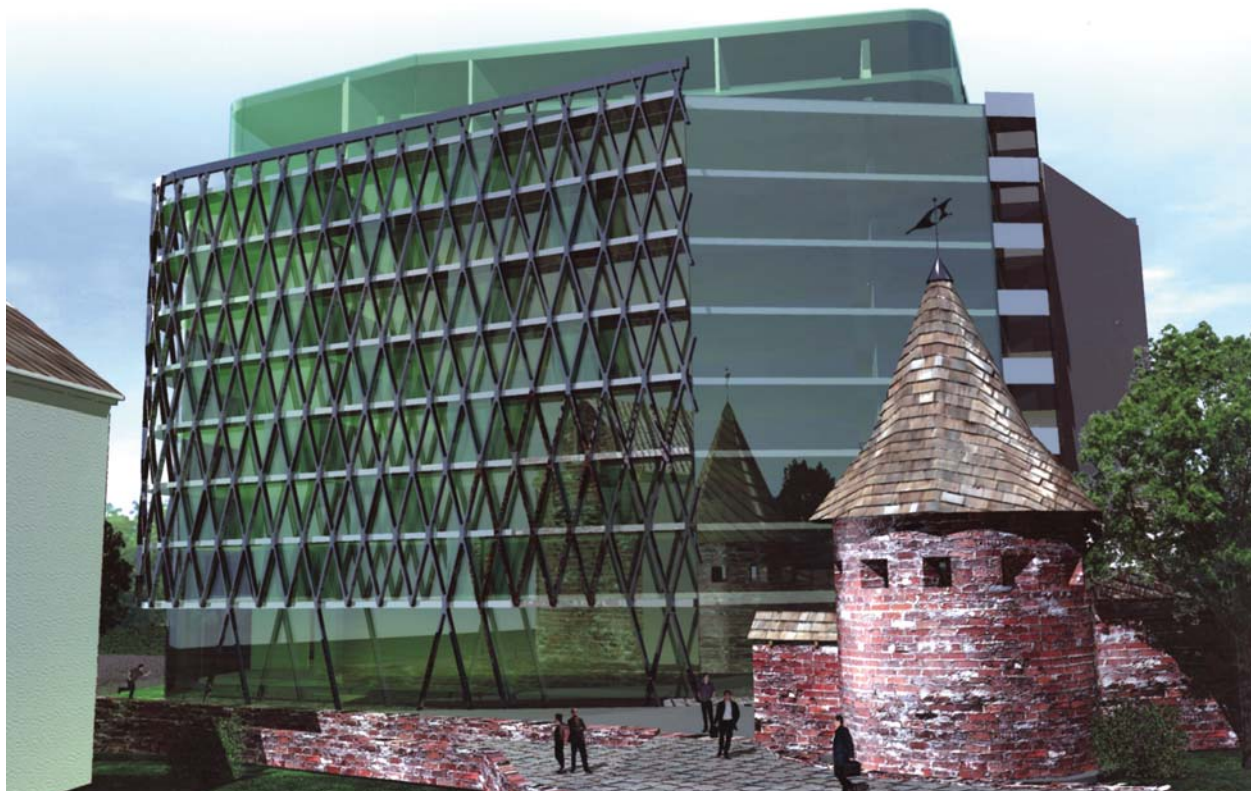
5 pav. Kauno miesto gynybinės sienos ir bokšto vizualinio eksponavimo gerinimas naujai statomo pastato, kaip ekspozicinio fono, reflektavimo efektais