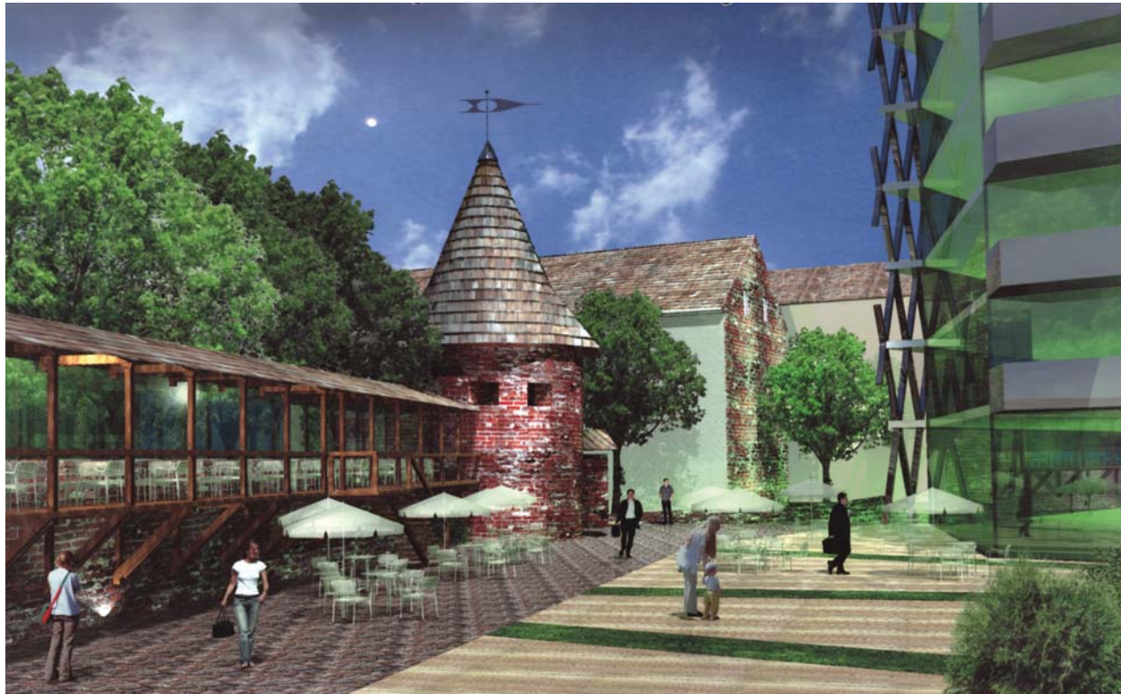
4 pav. Kauno miesto gynybinės sienos ir Malūnininko bokšto vizualinis ir mentalinis paviešinimas, suteikiant vietai ir objektui viešojo naudojimo funkciją