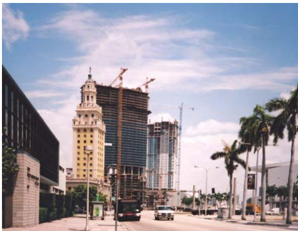
3 pav. Floridos „Laisvės rūmo“ eksponavimo gerinimas artimesnio ekspozicinio fono reflektavimo efektais (kairėje)

Fig 2. Respect of Freedom Palace in Florida. Formation of exhibitional (respect) background by increasing the height of obscure building in the background