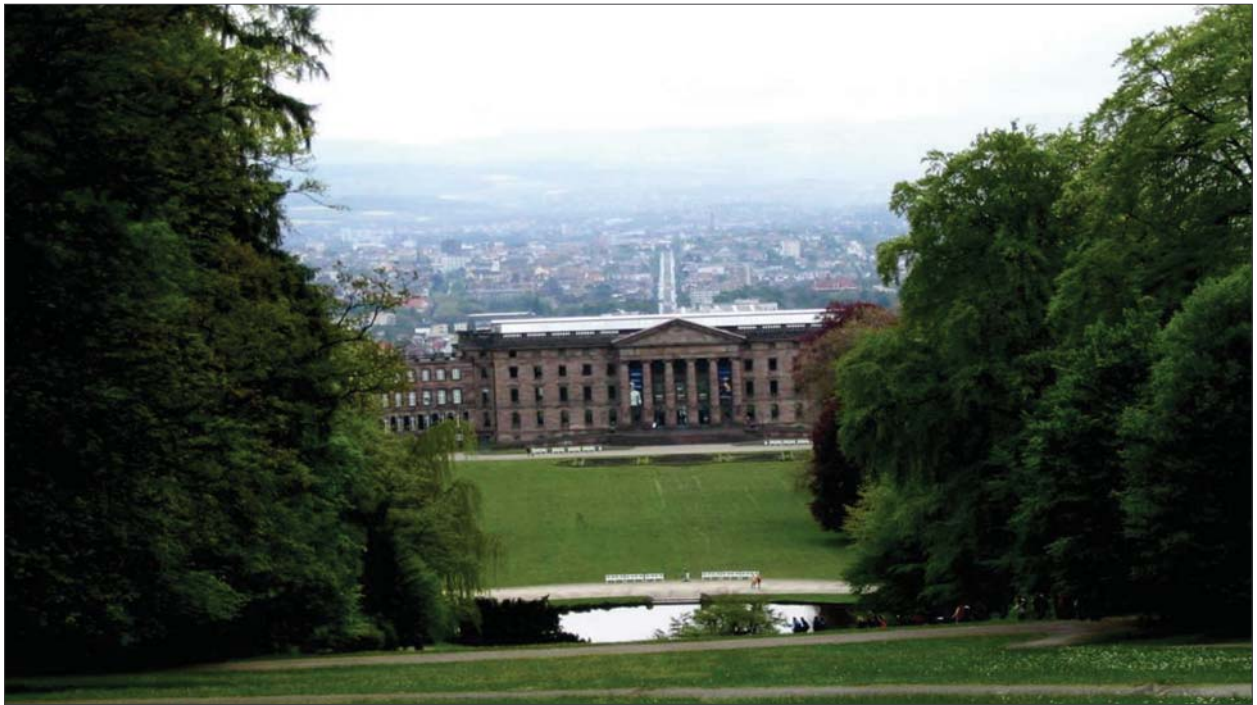
2 pav. Buvusi dvaro sodyba – potencialus visuomenės traukos centras, sudarantis sąlygas miestovaizdžio apžvalgai. Kaselis (Vokietija) (nuotrauka autorės, 2005)