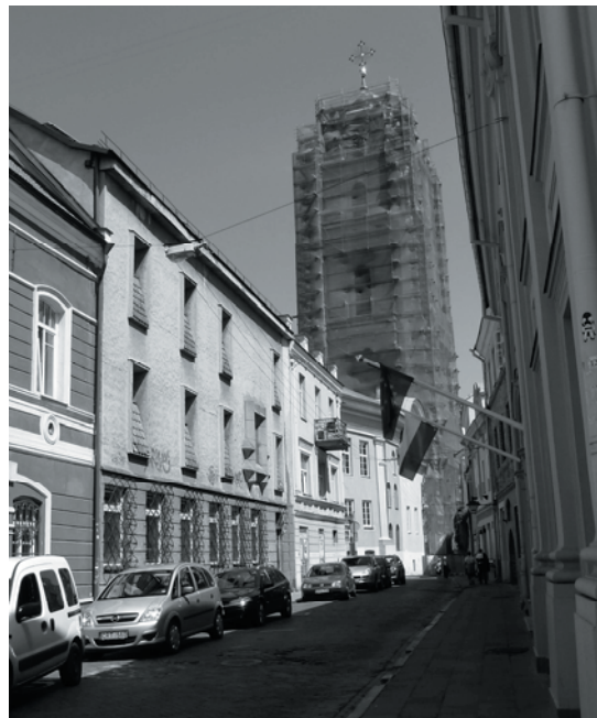
4 pav. Neinformatyvi pseudoistorinių formų architektūra: Vilnius