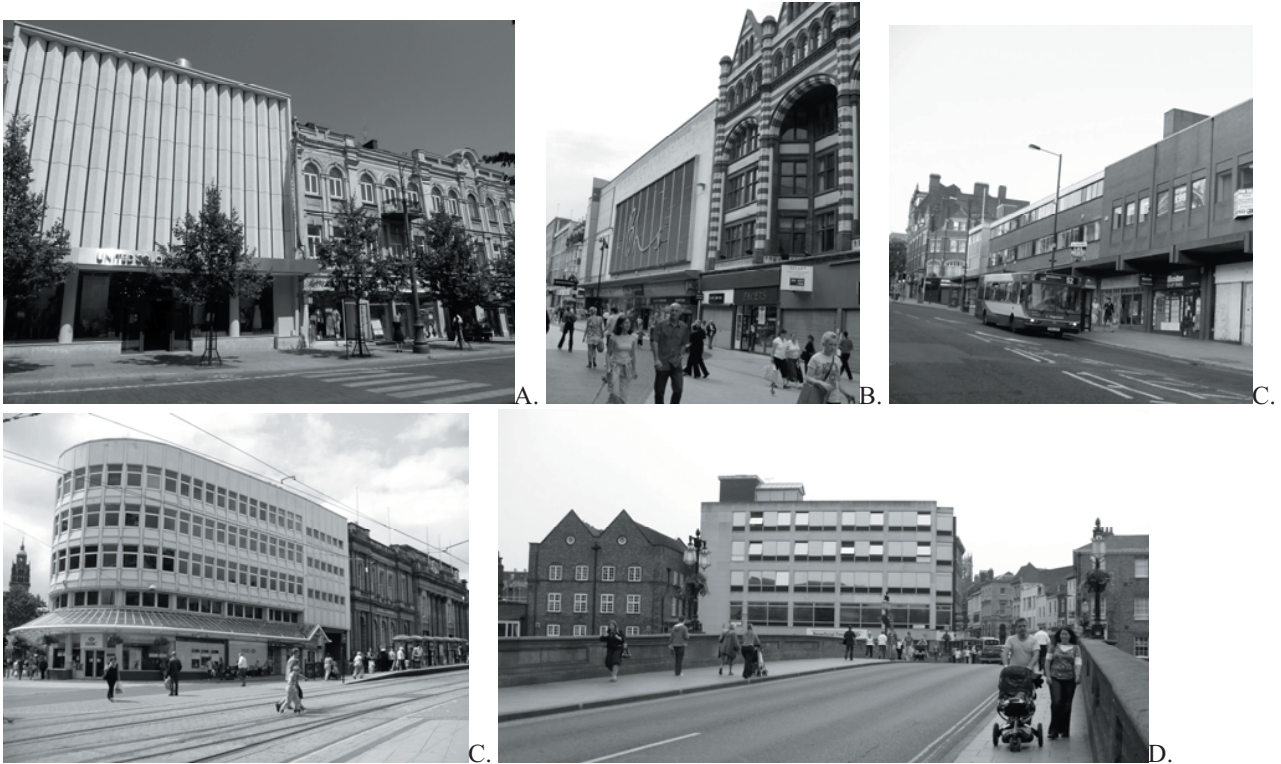
1 pav. Kontrastinga modernizmo architektūra istorinėje miestų aplinkoje: A. Vilnius, B. Liverpulius, C. Šefildas, D. Jorkas