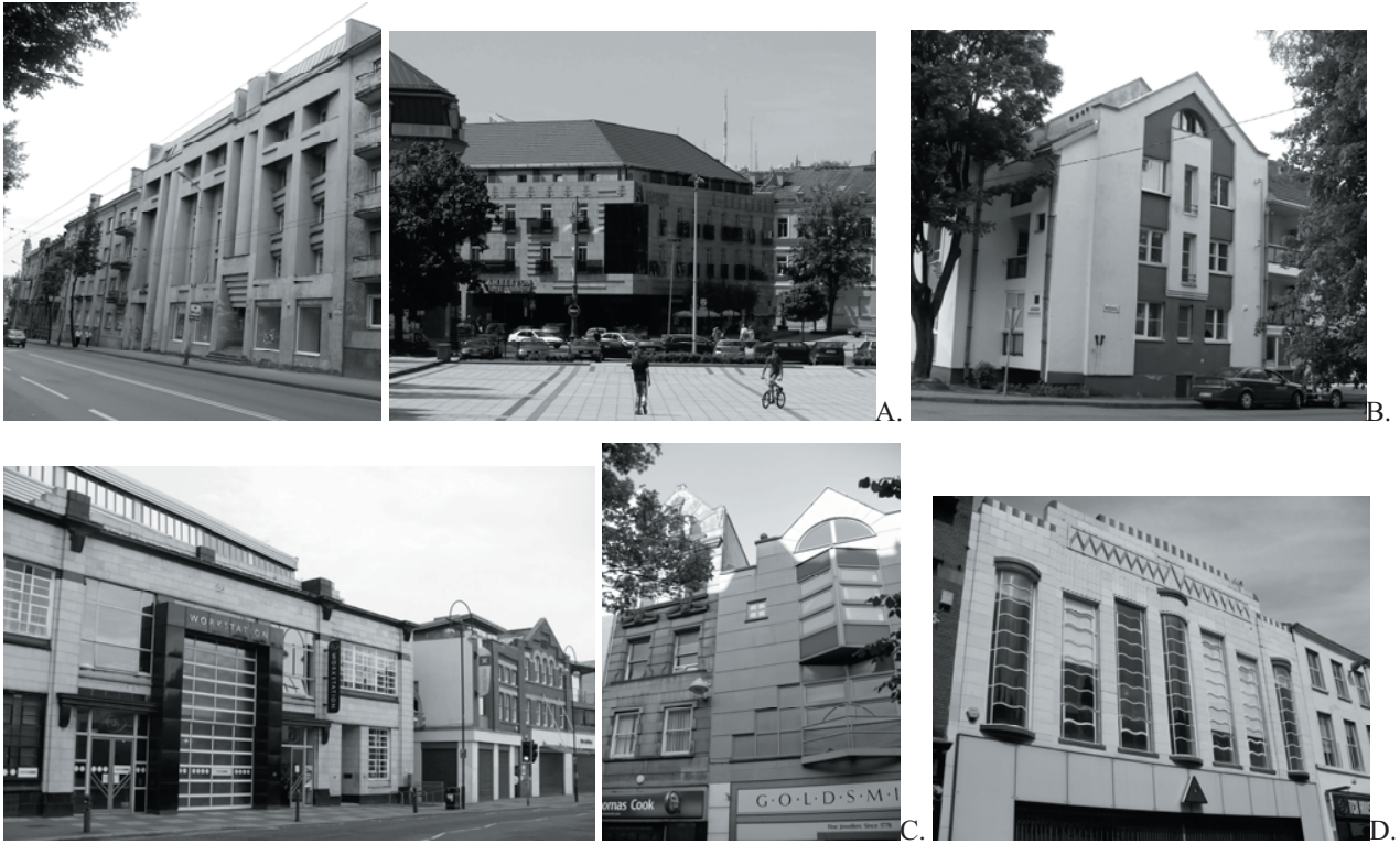
3 pav. Postmodernizmo architektūra istorinėje miesto aplinkoje: A. Vilnius, B. Kaunas, C. Šefildas, D. Liverpulis