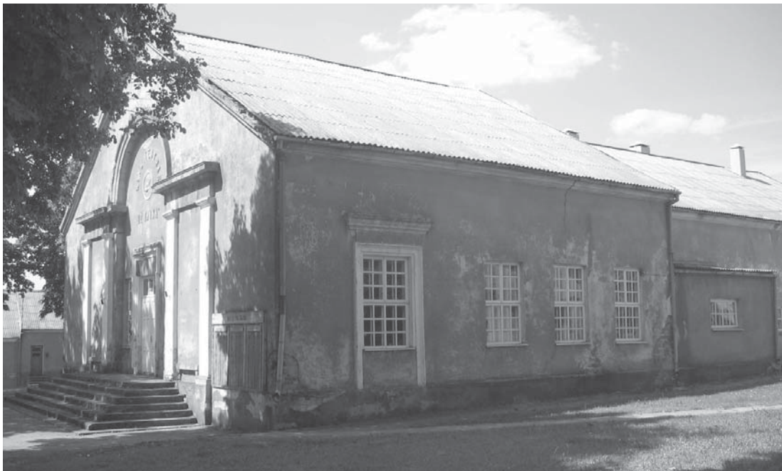
6 pav. Kino teatras „Už Taiką“ Salantuose. Apie 1952 m.