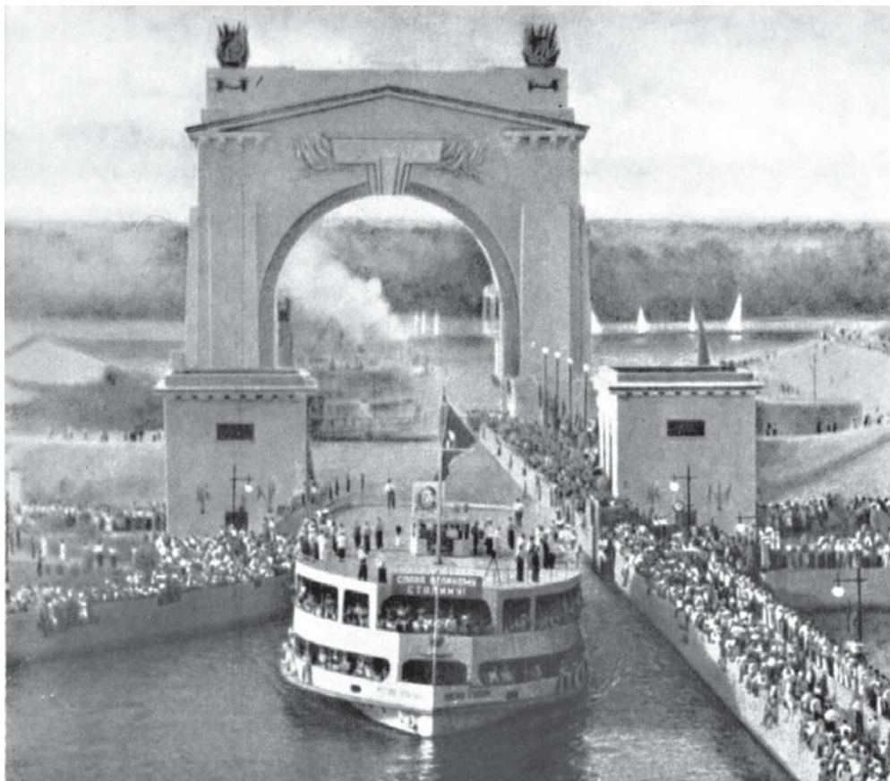
5 pav. Volgos–Dono kanalas.

Tokiai propagandai naudojamos įvairios priemonės: pastovus kartojimas, „akivaizdūs“ faktai ir pan. Vienas savitesnių šio reiškinio pavyzdžių – literatūrizuotas būsimo socialistinio miesto populiarinimas. Šiuose straipsneliuose lengva apsakymo forma pristatomas koks nors miestas, architektūrinis objektas ar projektas 23 . Kita svarbi propagandos priemonė – vaizdinis architektūros populiarinimas. Volgos–Dono kanalo statyba (5 pav.), prabangiosios Maskvos metro stotys, specifinio stiliaus Maskvos dangoraižiai ir kiti panašūs, įvairiuose leidiniuose nuolat reprodukuojami objektai virto tikrais architektūriniais socialistinio pasaulio (kurio neatsiejama dalis, žinoma, turėjo būti ir Lietuva) simboliais. Taigi, intensyviausios pokario propagandos laikotarpiu nesama jokio diskusinio aspekto, nesuteikiama jokių konstruktyvių istorinių ar teorinių architektūros žinių, vyrauja pompastiška retorika bei deklaracijos apie sėkmingą sovietinės architektūros plėtrą.