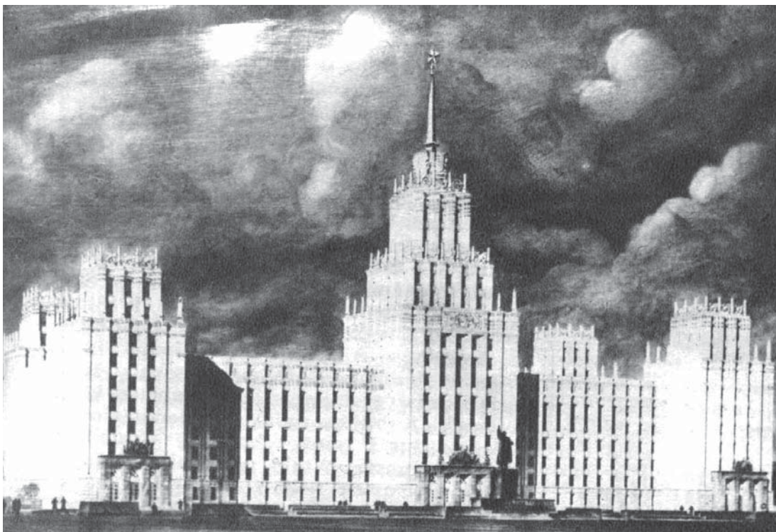
2 pav. Vyriausybės rūmų Vilniuje projektas, architektas V. Afanasjevas. Iliustracija iš: Švyturys , 1952, nr. 13, p. 11