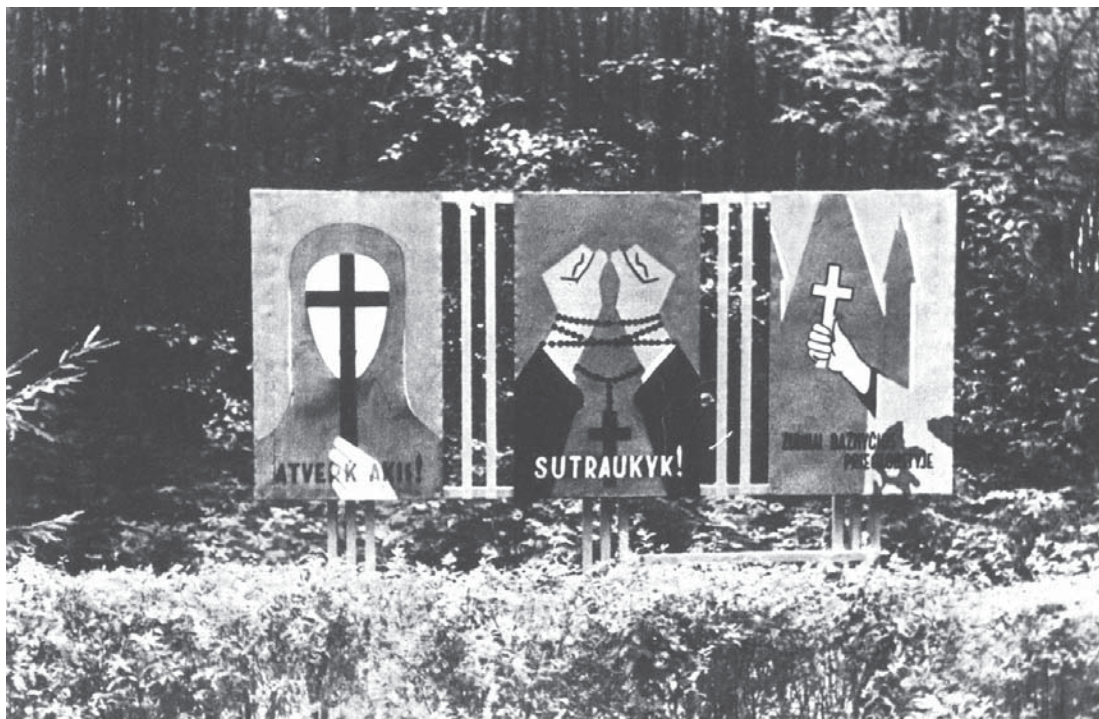
1 pav. Stendas ateistine tematika Rietave. Iliustracija iš: Vaizdinė agitacija , Vilnius: Mintis, 1965, il. 28