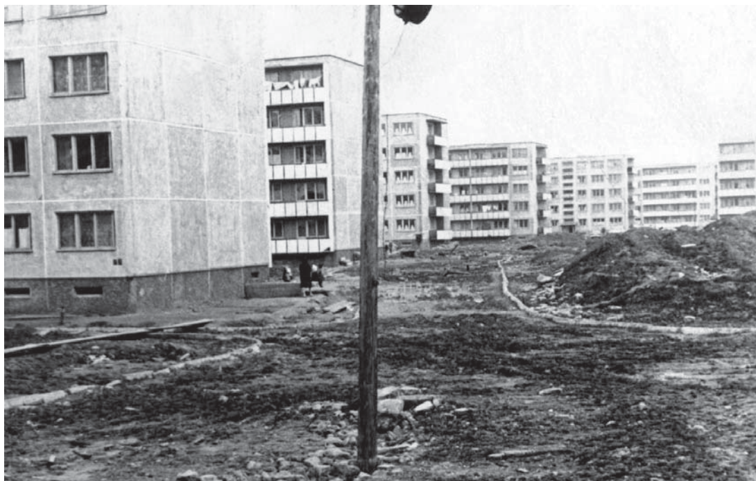
3 pav. Gyvenamojo kvartalo Kaune fragmentas. Apie 1964 m.

tik atspindi visuomenines bei politines realijas, bet kartu yra puikus įrankis šioms realijoms formuoti. Tai ryšku ir sovietmečio Lietuvoje. Nors pagrindinis dėmesys ugdant „tarybinį žmogų“, o kitaip tariant, lojalų ir paklusnų pilietį, buvo skiriamas švietimo sistemai, tačiau ir atskiroms kultūros bei meno sritims, tarp jų ir architektūrai, taip pat buvo suformuoti politiniai uždaviniai ir propagandinės vystymosi vizijos. Kuriami tiek privalomi ir mažai ką realiai reiškiantys lozungai: „išoriniame miesto architektūros veide turi atsispindėti ne tik materialinė liaudies gerovė, bet ir idėjinė-mėninė visuomenės pasaulėžiūra“ 21 , tiek skambūs apie greitą pažangą bylojantys šūktiniai: „Butą kiekvienai šeimai!“ Kaip tokia „liaudies gerovė“ ir „mėninė pasaulėžiūra“ paveikė realų miesto vaizdą, galime matyti tuometėje gyvenamojoje aplinkoje (3 pav.). Svarbiausias, visam sovietmečio laikotarpiui būdingas architektūrinio diskurso bruožas – bendra ir privaloma pozicija, atspindinti oficialiąją partijos liniją, išliko netgi kintant teorinei architektūros ideologų pozicijai.