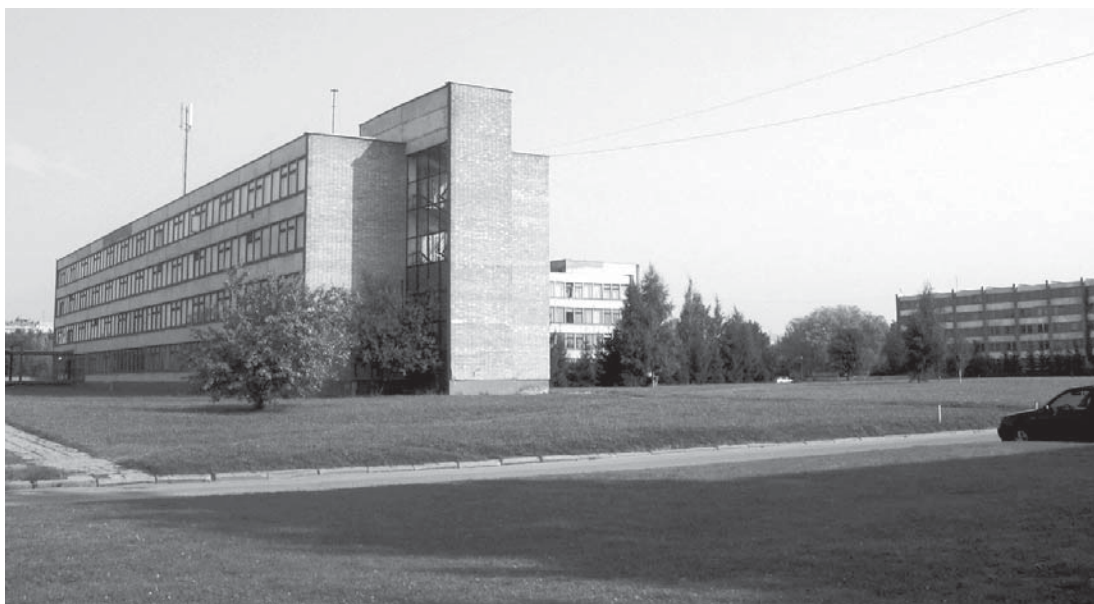
7 pav. Profesinio lavinimo mokyklų miestelio Kaune fragmentas.