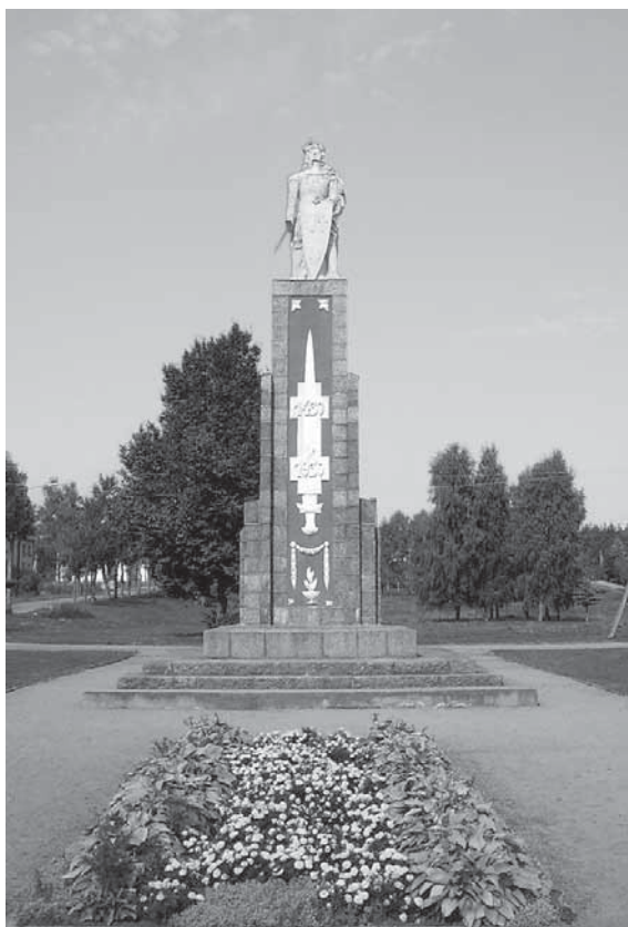
5 pav. Vytauto Didžiojo paminklas Perlojoje. Atidengtas 1931 liepos 18 d. Publikuota: Statyba ir architektūra , 1989, nr. 12.