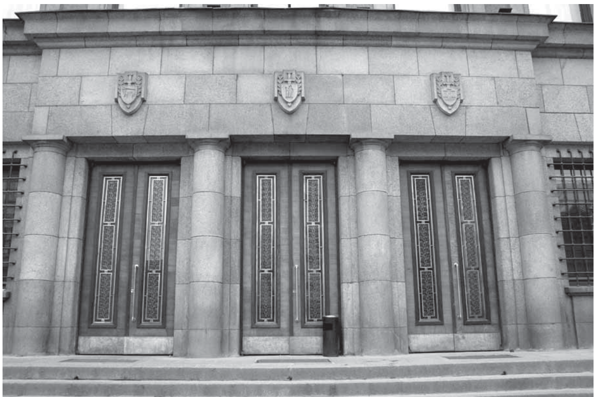
6 pav. Karininkų ramovės rūmai Kaune, A. Mickevičiaus g. 19. Architektas S. Kudokas, 1937. Fasado fragmentas su Vilniaus, Kauno ir Klaipėdos herbais.

Trečiasis, tiesa, kiek kuklesnio simbolinio užmojo, vadinamasis „tautos paminklas“, kurį pristatant visuomenėje taip pat stipriai akcentuoti tautinis ir politinis aspektai – Karininkų ramovė Kaune. Šiame, urbanistiškai kiek menčiau akcentuotame pastate, iliustratyvus dekoras įgyja dar svaresnę reikšmę. Tautinio stiliaus interjerus papildė eksterjere įkomponuoti B. Pundziaus kurti Vilniaus, Kauno ir Klaipėdos herbais, kurie „virš centrinio įj-