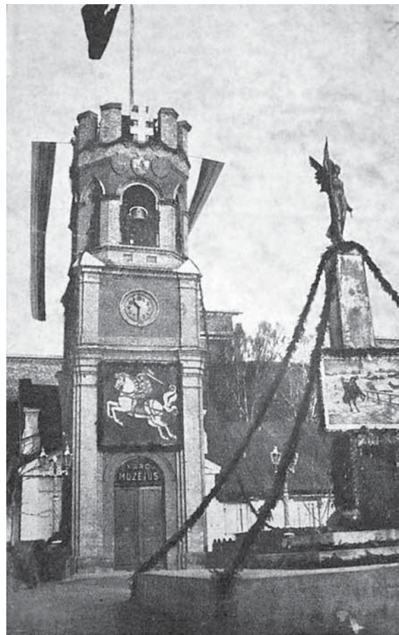
4 pav. Karo muziejus Kaune (nugriautas, pastačius Vytauto Didžiojo muziejų). Rekonstrukcijos aut. V. Dubeneckis. 1921. Iliustracija iš knygelės Akiras. Karo muziejus. Kaunas, 1930.

Čia pat tenka atkreipti dėmesį, kad istorinis paveldas, jo populiarinimas taip pat tapo svarbia architektūrinės kultūros dalimi, besisiejanti su tautinio identiteto puoselėjimu. Patrauklūs architektūros objektų aprašymai, siejant juos su romantizuota istorijos interpretacija, gana dažnas reiškinys tarpukario spaudoje. Atsitiktinai ar ne, nevengiama ir istorinei LDK priklaususių teritorijų, Vilniaus krašto architektūrinių įdomybių, populiarinimo. O tūlo