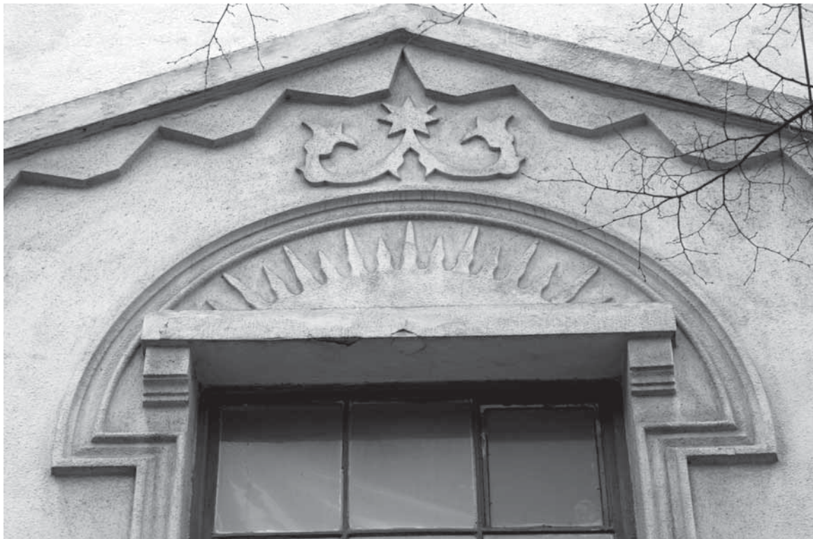
1 pav. Kooperatyvo Tulpė gyvenamasis namas Kaune, A. Mickevičiaus g. 15. Architektas A. Maciejauskas, 1926.

Pirmuoju etapu bene lemiamą vaidmenį suvaidino liaudies meno tyrėjai ir puoselėtojai, kurie neabejojo, kad geriausias pagrindas tautiniam stiliui – liaudies menas plačiąja prasme. Ne viename tekste pabrėžiamas lietuvių „dailės jausmas“, jo polinkis į ornamentiką: „puoštas kryžius, kaip jis pasireiškė mūsų liaudies meno kūryboje – reikia sakyti yra Lietuvos tautiškas veikalas, yra savo rūšies mūsų piramidės.“ 7 Pirmaisiais nepriklausomybės metais vyrauja tendencija populiarinti būtent tokio pobūdžio, matyt, lengvai suprantamą, tradicinę, agrarinės valstybės palikimą atspindinčią, architektūrą.