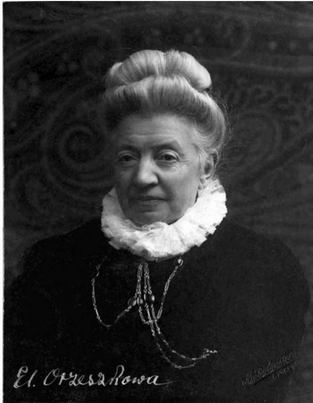
4 pav. Eliza Orzeszkowa paskutiniaisiais gyvenimo metais.