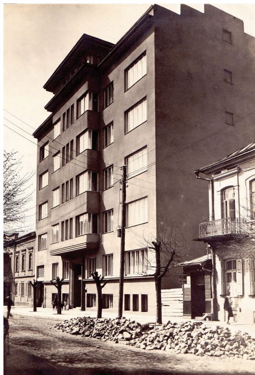
7 pav. Buvęs M. Chaimsono gyvenamasis namas (arch. V. Landsbergis-Žemkalnis, 1931).

1927 m. rašė Vladas Švipas: „Mūsų miestuose yra daug istorijos dokumentų, mūsų visai nebejaudinančių, nes jie savo laiką pralaukė. Todėl, suprantamas dalykas, kokią atsakomybę turi dabartiniai architektoriai, kurie tebestato istoriniais stiliais. Tie jų namai yra mumijos, yra lavonai paskirti šimtmečiais viešai stovėti.“ 67 Lietuviškoje mintyje galime apčiuopti ir Le Corbusier dvasia aiškinamą suvokimą, kad „funkcinė architektūra esminga yra ne formos, kurios dabar įeina į madą (horizontalinės linijos, statūs kampai, lygios sienos, plokšti stogai) ir net ne naujų medžiagų (geležies, stiklo, betono) pritaikymas, bet aiškus supratimas to, kad geležinkelio stoties architektūrą nustato tie patys techniški principai, kaip ir garvežio konstrukcija“ 68 . Vis dėlto, nors teorinis kontekstas leidžia svarstyti modernią prieigą, net ir patys moderniausi to meto pastatai greičiau iliustruoja V. Landsbergio suformuotą mintį apie „monumentalinės statybos klasinį ritmą moderniškoje formoje“ 69 (7 pav.). Tad lietuviškasis kontekstas tarpukario architektūros palikimui, ko gero, leistų taikyti ir istoriniams pastatams