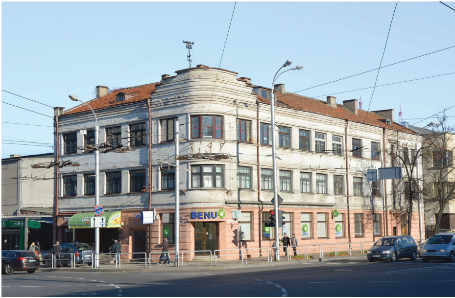
8 pav. Buvęs „Locarno“ viešbutis (arch. E. Peyeris, 1923).

būdingą teorinę paveldosaugos prieigą. Bent jau vertinant medžiagiškumo aspektu.