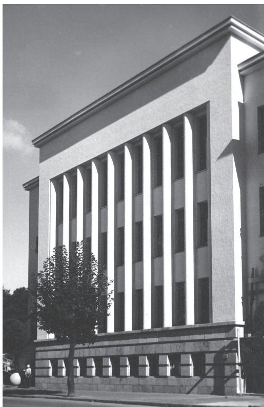
6 pav. Klasikinis ritmas Prekybos, pramonės ir amatų rūmuose. NČDM, Ta-5337

įvairiais apvadais, vertikalia ritmika papuoštuose fasaduose (6 pav.) vargu ar įžvelgsime gilų tikėjimą tuo, kad besikeičiantis pasaulis turi būti išreikštas naujomis, tik jam būdingomis formomis. Tiesa, teoriniame diskurse esama pakankamai užuominų, kad radikaliosios modernizmo idėjos bent jau specialistų rate buvo puikiai žinomos. Kaip