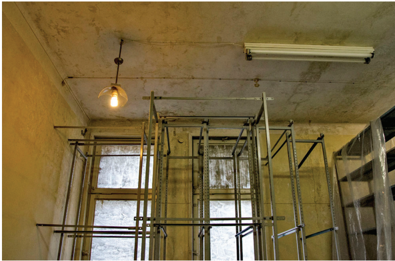
2 pav. Avarinės būklės lubos buvusiuose Prekybos, pramonės ir amatų rūmuose (dab. Kauno apskrities viešoji biblioteka).

dėmesį skiriant autentiškumo ir vertės problematikai), tikintis, kad tam tikros teorinės įžvalgos galėtų padėti identifikuoti situacijos priežastingumą ir galbūt paskatinti diskusijas apie metodologinius priegais taškus, sudarančius sąlygas efektyvesniam šio palikimo valdymui.