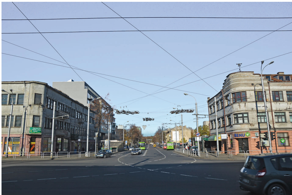
1 pav. Apšiuurę modernistinio Kauno „vartai“ žvelgiant nuo geležinkelio stoties.

itin platus šio architektūrinio palikimo sluoksnis yra visiškai susidėvėjęs, ir, galima spėti, atlieka bemaž priešingą funkciją – liudija apie miesto audinio retėjimą ir skurdėjimą. Nors ryškiausiai šie procesai atsiskleidžia objektuose, kuriuos galėtume sieti su kasdienybės paveldu (1 pav.), tačiau net ir svarbiausi tą metą reprezentuojantys pastatai, kaip antai centrinis paštas, Tyrimų laboratorija, Prekybos pramonės ir amatų rūmai, yra tapę apverktinos būklės (2 pav.). Tad šio straipsnio tikslas – įvertinti kaunietiškąją tarpukario architektūrą žvelgiant iš šiaurinės paveldosaugos diskurso pozicijų (ypatingą