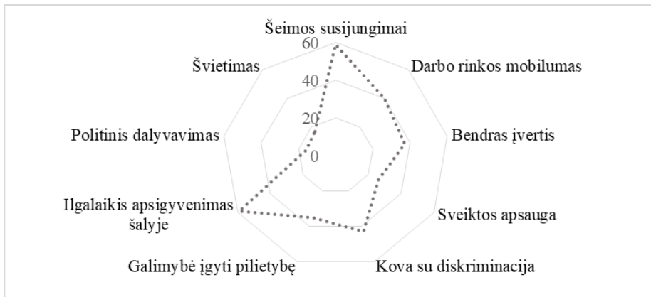
2 pav. 2014 metų Lietuvos migrantų integracijos politikos indeksas (MIPI)

Pradžioje svarbu apžvelgti, kaip 2014 m. imigrantų integracijos sąlygos Lietuvoje buvo įvertintos pagal Migrantų integracijos politikos indeksą (MIPI) (2015). MIPI galima laikyti unikalia priemone, pagal kurią politikos formuotojai, nevyriausybinės organizacijos, mokslininkai, Europos ir tarptautinės institucijos naudoja savo duomenis ne tik siekdamos suprasti ir palyginti nacionalinę integracijos politiką su kitomis šalimis, bet ir gerinti imigrantų integracijos efektyvumą. Pagal MIPI indeksą imigrantų integracijos politika yra formuojama ir tobulinama visoje ES valstybėse narėse, Australijoje, Kanadoje, Islandijoje, Japonijoje, Pietų Korėjoje, Naujojoje Zelandijoje, Norvegijoje, Šveicarijoje, Turkijoje ir JAV (MIPI, 2015). Sudarant MIPI indeksą yra vertinami 7 pagrindiniai indikatoriai: darbo rinkos mobilumas, šeimos susijungimas, edukacija, politinis dalyvavimas, ilgalaikis apsigyvenimas šalyje, galimybė įgyti šalies pilietybę ir kova su diskriminacija. Kiekvienas indikatorius gali būti vertinamas nuo 0 (visiškai nepalankus) iki 100 (palankus) (žr. 2 pav.).