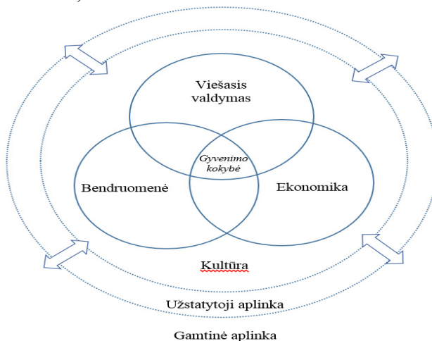
1 pav. Regiono sistemos posistemės