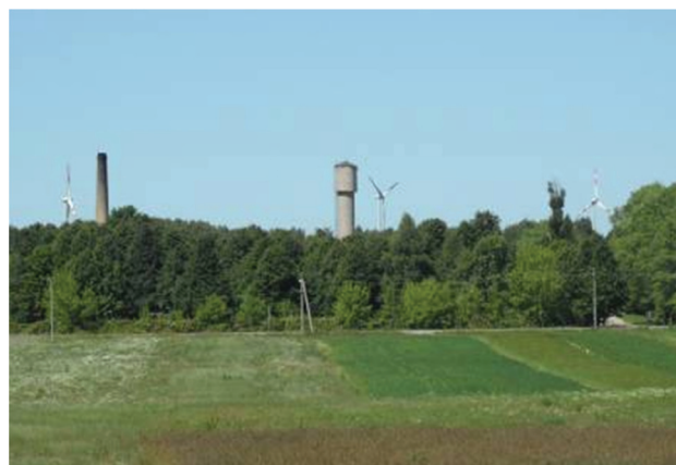
2 pav. Vėjo elektrinės Kretingos miesto vakarinės dalies kraštovaizdyje. Matoma perteklinė vizualinė tarša

Fig. 1. The wind turbine in the zone of visual impact of Kretinga – Darbėnai way. New vertical dominant