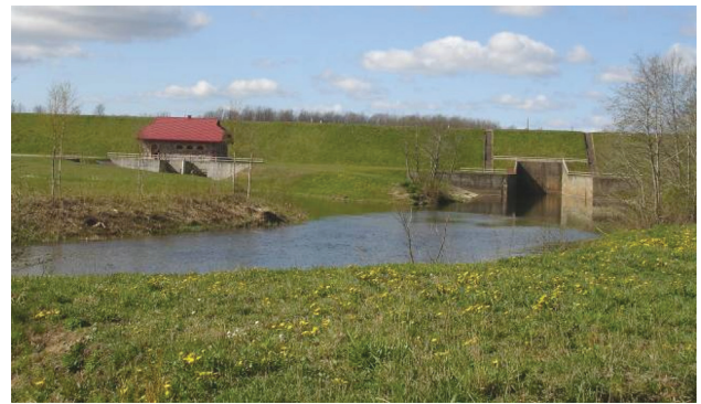
3 pav. Skuodo miesto hidroelektrinė ir aplinka (nuotr. aut. J. Abromas, 2010)

Hidroelektrines pastačius esamų užtvankų vietose, užtvankos labiau prižiūrimos, tampa saugesnės, o prieš didesnes liūtis galime nuleisti vandens lygį, taip užtikrinant papildomą rezervuarą vandens kaupimuisi liūčių metu. Tinkamai sutvarkyta šalia užtvankos esanti teritorija gali būti pritaikoma rekreacinei veiklai ir praturtinti kraštovaizdį (žr. 3 pav.).