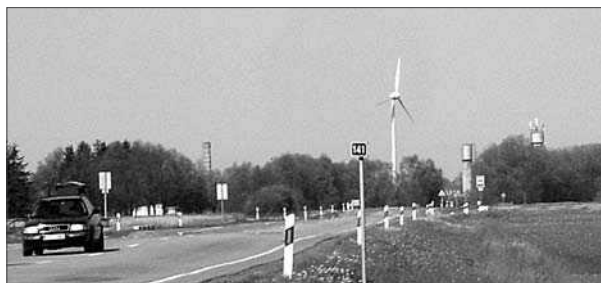
2 pav. Pirmoji vėjo jėgainė ties Vidmantais, Kretingos–Palangos kelio perspektyvoje

Kai Palangos įtakos zonoje (šalia Vydmantų gyvenvietės) iškilo pirmoji parodomoji pramoninė vėjo jėgainė (2003 m. pastatyta Kaišiadorių ir Magdeburgo vyskupijos iniciatyva), prieštaraujančių nebuvo, atvirškčiai – atvažiuojantys iš kitų Lietuvos regionų džiaugdavosi šiuo nauju ir įdomiu objektu. Kultūriniam kraštovaizdžiui šis objektas didesnio poveikio neturėjo. Važiuojančius į Palangą valstybiniu keliu A11 jėgainės vertikalė pasitinka kelio panoramos viduryje. Vieta buvo parinkta racionaliai – magistralinio dujotiekio apsaugos zonoje (2 pav.).