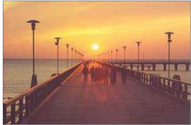
7 pav. Saulės palydų tradiciją gali sutrikdyti planuojami vėjų jėgainių parkai jūroje