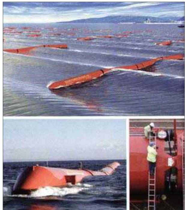
4 pav. Bangų energetiniai įrenginiai, darantys stiprų vizualinį poveikį jūriniam kraštovaizdžiams

Alternatyvios atsinaujinančios energijos naudojimas veikia kraštovaizdžius dvejopai: teigiamai ir neigiamai. Teigiamas poveikis pasiekiamas dėl kieto kuro, naftos degimo procesų sumažėjimo, mažėjančių transportavimo šrautų ir kt. Vertinant tai, kad iškasami ištekliai po kurio laiko baigsis, bus visiškai pereita prie atsinaujinančios energijos naudojimo. Neigiamą poveikį šiuo metu daugiausia daro griozdiški vėjo jėgainių įrenginiai ir bangų energetiniai įrenginiai (4 pav.).