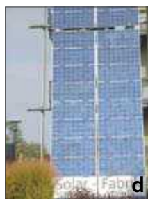
5 pav. Saulės energiją kaupiantys namai. Pastatų stogai, dengti saulės kolektoriais, kurie keičia jų architektūrinę raišką (a, b, c, d)