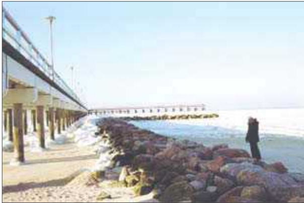
6 pav. Tinkamai sutvarkyti statiniai galėtų veikti kaip krantų stabilizavimo ir kaip bangų energetikos jėgainės