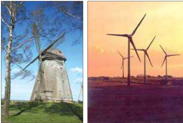
1 pav. Malūnai kraštovaizdyje: senasis malūnas Lazdininkuose ir vėjo jėgainių ferma Kretingos rajone

tybės dėmesys pajūryje skirtinas rekreacijos plėtotei (Vakarų... 2002, Lietuvos... 2002). O intensyvėjant užstatymui rekreacinis regiono potencialas menksta. Kai kurių Lietuvos pajūrio gyvenviečių, rekreacinių ir kitų teritorijų šiandieninis išpūdis labai prastas, kraštovaizdis vis labiau praranda savitumo ženklus, mažėja pajūrio ruožo rekreacinis imlumas. Tipinių energetinių įrenginių gausėjimas mažina regiono architektūrinį savitumą. Senieji malūnai tapo regiono kraštovaizdžio vertybėmis, o naujos vėjo jėgainės pernelyg disonuoja su gamtiniu kraštovaizdžiu (1 pav.). Todėl būtina kuo skubiau ieškoti priemonių, kaip naudoti naujus tipinius elementus, užtikrinant pastatų ir kraštovaizdžių savitumą.