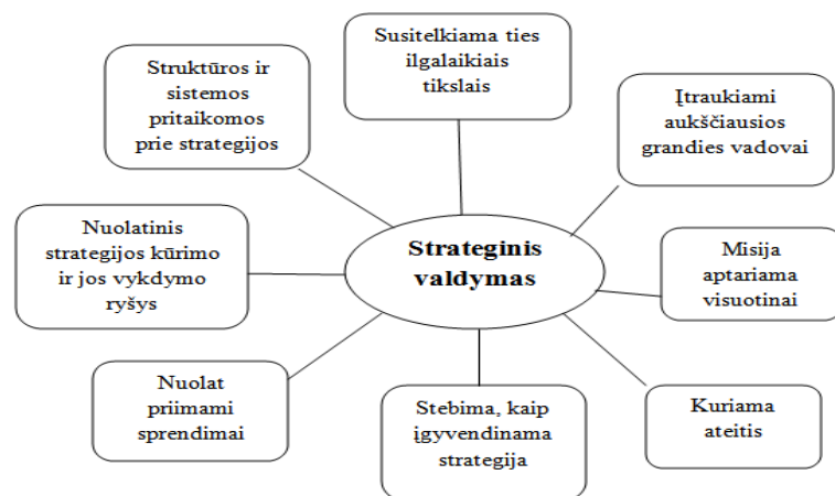
2 pav. Bendrieji strateginio valdymo bruožai (Arimavičiūtė, 2005)

Organizacijos strateginiu valdymu laikomas nuolatinis, dinamiškas ir nuoseklus procesas, kuriuo remdamasi organizacija laiku prisitaiko prie išorinės aplinkos pokyčių ir efektyviau naudoja išteklius. Strateginio valdymo procesas leidžia parengti ir įgyvendinti organizacijos strategijas kaip sprendimų visumą, numatančia svarbiausius organizacijos tikslus ateityje, veiksmus ir priemones tikslams pasiekti (Arimavičiūtė, 2005).