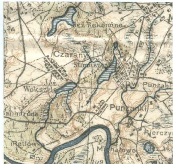
5 pav. Stavistis ežero aplinka. Lenkijos M 1:100 000 topografinio žemėlapio NIEMENCZYN PAS 29 SLUP 41, 1926 m. fragmentas (padidintas 1,5 karto)

5. Vertinant Lietuvių kalbos komisijos veiklą tenka teigti, kad Valstybinės kalbos komisijos pastangos diegti taisyklingus vietovardžius iki šiol norimų rezultatų neužtikrina, todėl kartografams sunku išvengti netikslumų įvardijant gyvenvietes, ežerus, tvenkinius bei vandentakius.