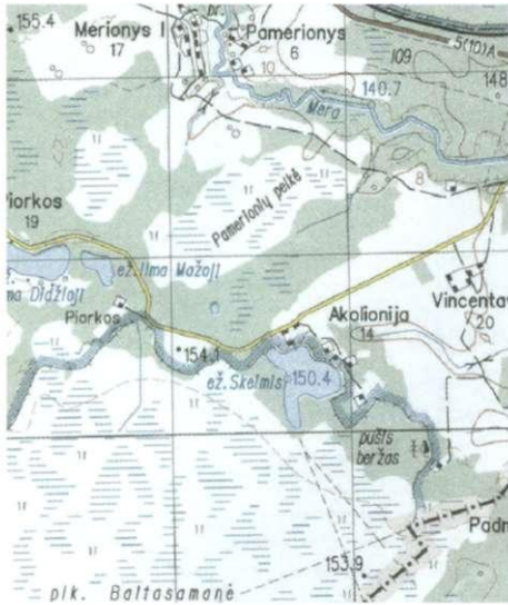
4 pav. Skeitis ežero aplinka. Lietuvos M 1: 50 000 topografinio žemėlapio PABRADĖ N-35740-AB, 2001 m. fragmentas