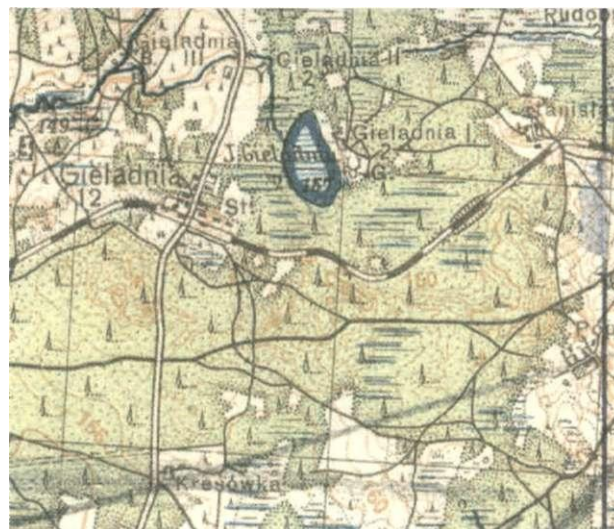
3 pav. Gelednios ežero aplinka. Lenkijos M 1: 100 000 topografinio žemėlapis MICHALISZKI PAS 29 SLUP 42 fragmentas, 1933 m.