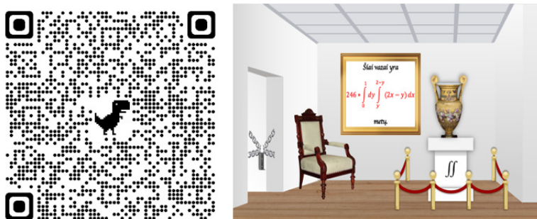
2 pav. „Integralų galerijos“ 7 kambarys.